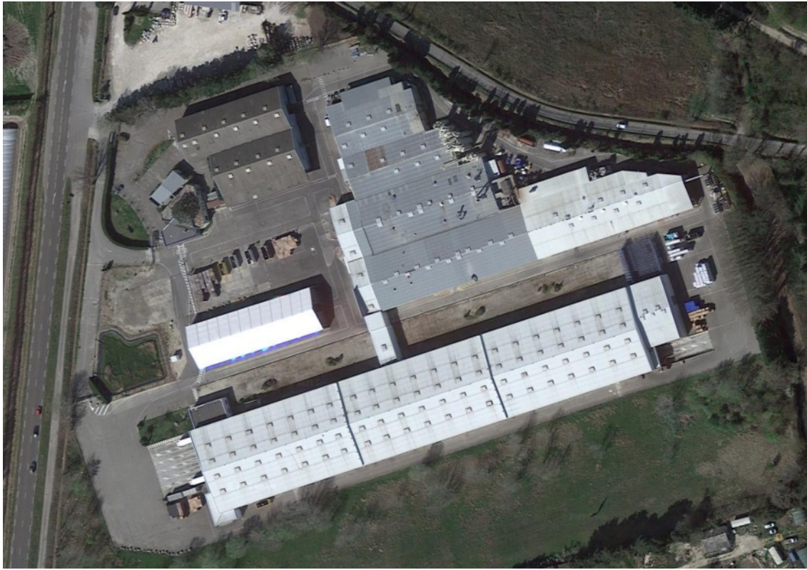
Figure 2 – Vue aérienne de l'usine